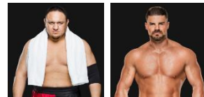
サモア・ジョー ホビー・ルード